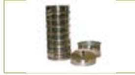
Şekil 4: Elek Analizi Seti