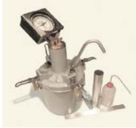
Şekil 7: Hava Tayin Cihazı

Deney tamamlandıktan sonra A ve B vanaları açılarak basınçlı hava boşaltılır ve kelepçeler gevşetilerek kapak düzeneği çıkartılır.