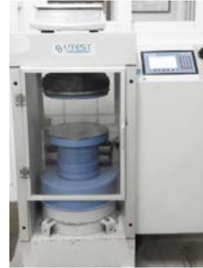
Şekil 9: Beton Presi

Basınç dayanımı en yakın 0,5 MPa'ya (N/mm 2 ) yuvarlatılarak gösterilmelidir.