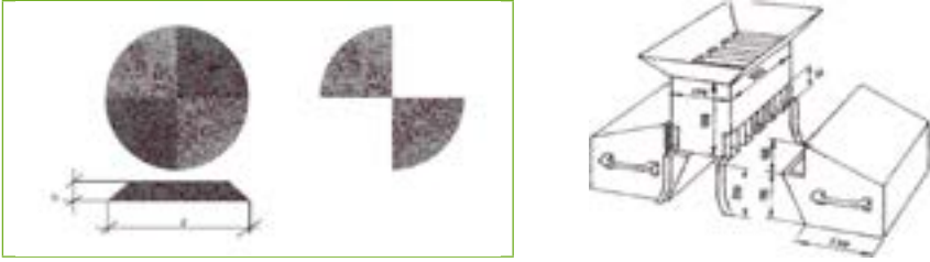
Şekil 1: Dörtleme Metodu ve Bölgeç Aleti

Bir agregaya yığınının numune alırken dikkat edilmesi gereken en önemli husus, alınan numunenin agregaya yığınını temsil etmesidir. Tersi durumlar yanlış sonuçlar doğurur. Numuneyi yığının tepe ya da etek bölümünden değil, orta noktalardan değişik bölgelerden dikkatlice almak gerekir. Toplanan örnekleri homojen şekilde karıştırılıp, bir deneye yetecek şekilde küçültmek gerekir. Bu işlem, bölgeç ya da çeyrekleme yöntemiyle yapılır. Laboratuvar numunesi çalışma yüzeyine konular. Koni oluşturacak şekilde numune tam olarak karıştırılır ve kürekle numuneler alınmak sureti ile yeni bir koni oluşturulur. Bu işlem 3 defa tekrar edilir. Her bir kürek dolusu numune, agregalar oluşturulan yeni koninin tepesinden, her kenardan gelecek ve tam bir dağılım sağlayarak farklı büyüklüklerin iyi bir şekilde karışmasına imkân verecek şekilde dökülmelidir. Belirlenen deney kısmı elde edilinceye kadar karıştırma ve çeyrekleme işlemi tekrarlanır.