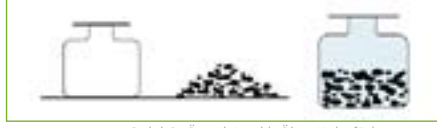
Şekil 2: Özgül Ağırlık Ölçü Kabı (Piknometre)