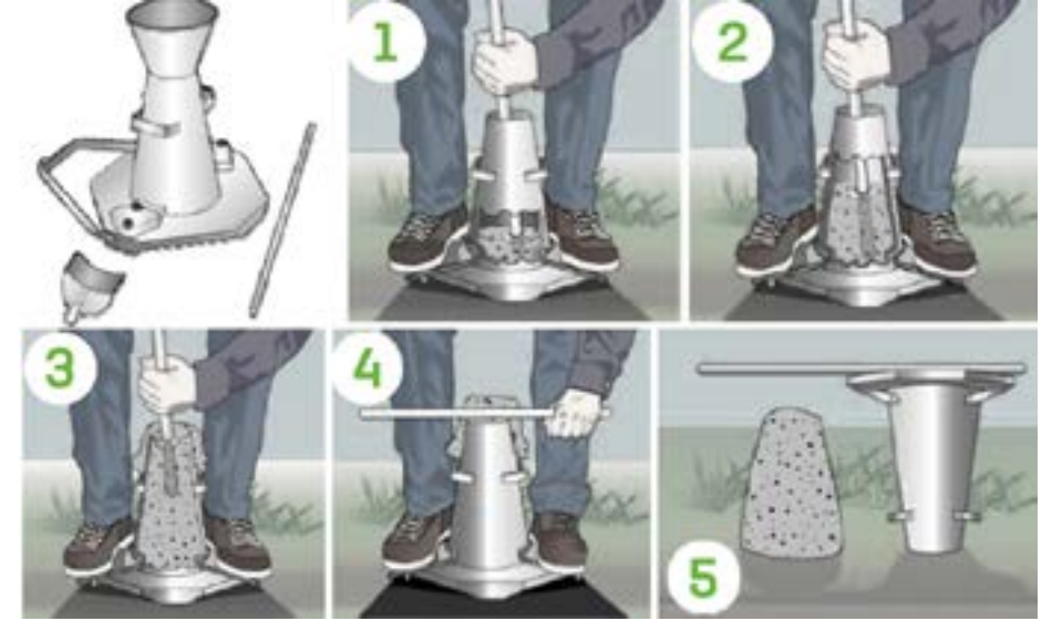
Şekil 6: Slump (Çökme) Deneyi

Taze beton, kesik huni şekilli kalıp içerisine sıkıştırılarak doldurulur. Kalıbın yukarı doğru çekilerek alınmasından sonra, taze beton kütesindeki çökme mesafesi, betonun kıvam ölçüsü olarak kullanılır. Şekil 6'da slump deneyi resimler ile adım adım gösterilmektedir.