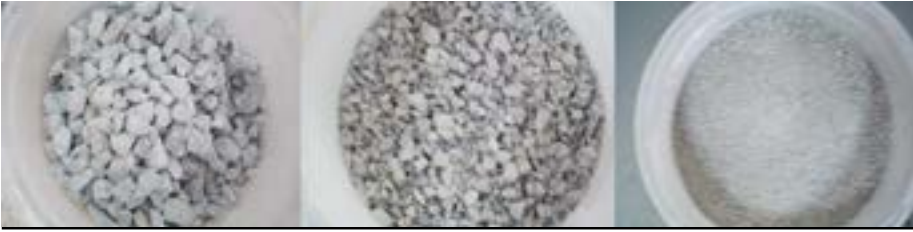
Şekil 3: Farklı Dane Çaplarında Agrega Yığınları

Elek analizi deneyi, agregaların kare gözlü standart deney eleklerinden elenmesi yolu ile, tane dağılım büyüklüğünün (Şekil 3) bütün agrega karışımına ağırlıkça oranı ile 1 m 3 beton içerisindeki agrega yüzdelerinin bulunmasıdır.