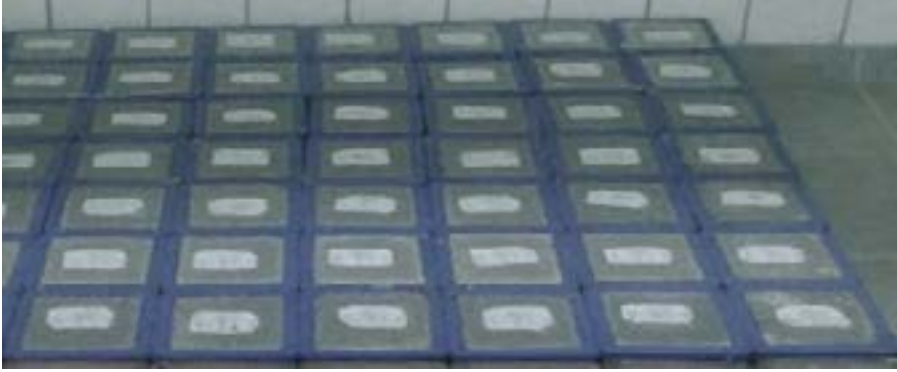
Şekil 8: Beton Numune Kalıpları

Sıkıştırma işleminden sonra kalıplardaki beton yüzeyi düzlemi perdahlanır. Bu amaçla, kalıp üst yüzeyinden taşan beton, şişleme çubuğu veya mala ile sıyrılır, düzlenen yüzey mala veya master ile perdahlanır. Bu işlemler en kısa zamanda ve en pratik şekilde tamamlanmalıdır. Elde edilen numune yüzeyi, kalıp kenarları ile aynı seviyede olmalı, yüzeyde kalabilecek girinti veya çıkıntılarının boyutları 3 mm'yi geçmemelidir.