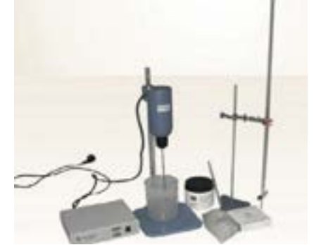
Şekil 5: Metilen Mavisi Seti